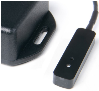
THP Sensor Detail